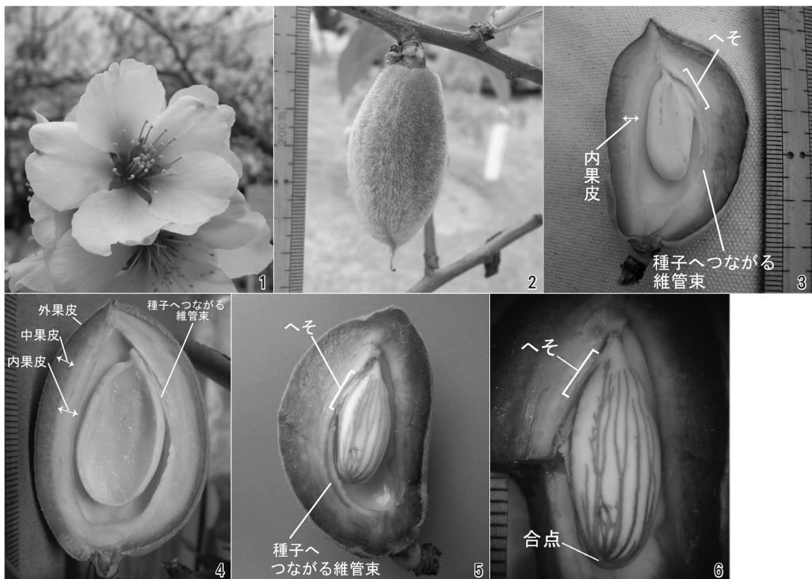
図1～6：アーモンドの花と果実。図1：花。直径4.1cm。図2：果実。花柱と柱頭が残っている。長さ5.5cm。図3：果実の縦断面。種子が右上のへそで内果皮と結合して、ぶら下がっている。白い部分が内果皮になる。長さ5.7cm。図4：果実と種子の縦断面。種子の内部は、ゼリー状である。長さ4.9cm。図5：果実の縦断面。内果皮から種子へのびる維管束と種皮に広がる維管束が見える。左上がへそ。細長い。長さ5.2cm。図6：種子のへそと種子の維管束。図5の拡大。写真はすべて神戸市の東洋ナッツ食品株式会社で植栽されていたアーモンドを採集・撮影。図1、2013年3月23日；図2～7、5月10日。

5月頃にアーモンドの果実を縦に切ってみると図3、4のようになっています。種子はまだ白く、成熟しつつあります (図3)。種子の周りにある白い部分 (色の薄い部分) が固い殻 (内果皮) になりま