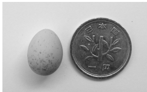
とても小さなエナガの卵。