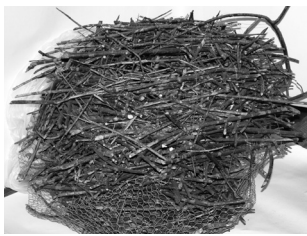
カササギの巣。木の枝でつくったボール、直径約70cm。