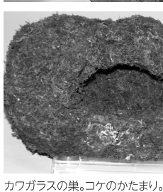
カワガラスの巣。コケのかたまり。