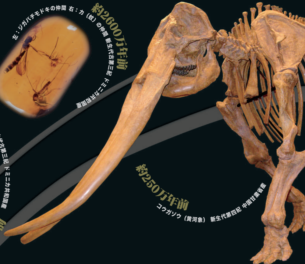
約250万年前 ゴウガソウ（黄河象） 新生代第四紀 中国甘肃省産