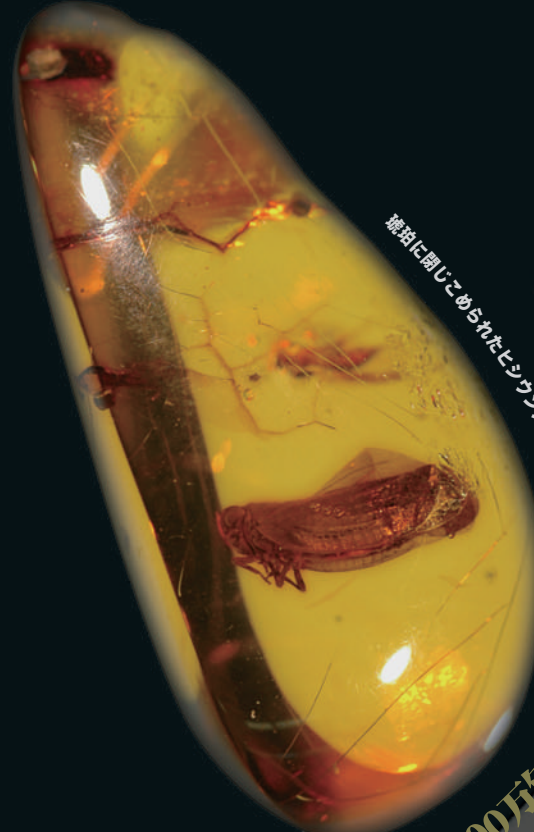
琥珀に閉じこめられたヒシツカ 新生代古第三紀 トニニカ共和国産