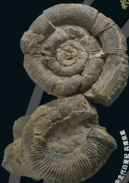
中生代白垩紀 兵庫県産